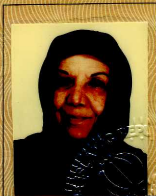
PHOTOGRAPHIE DU TITULAIRE PHOTOGRAPH OF BEARER